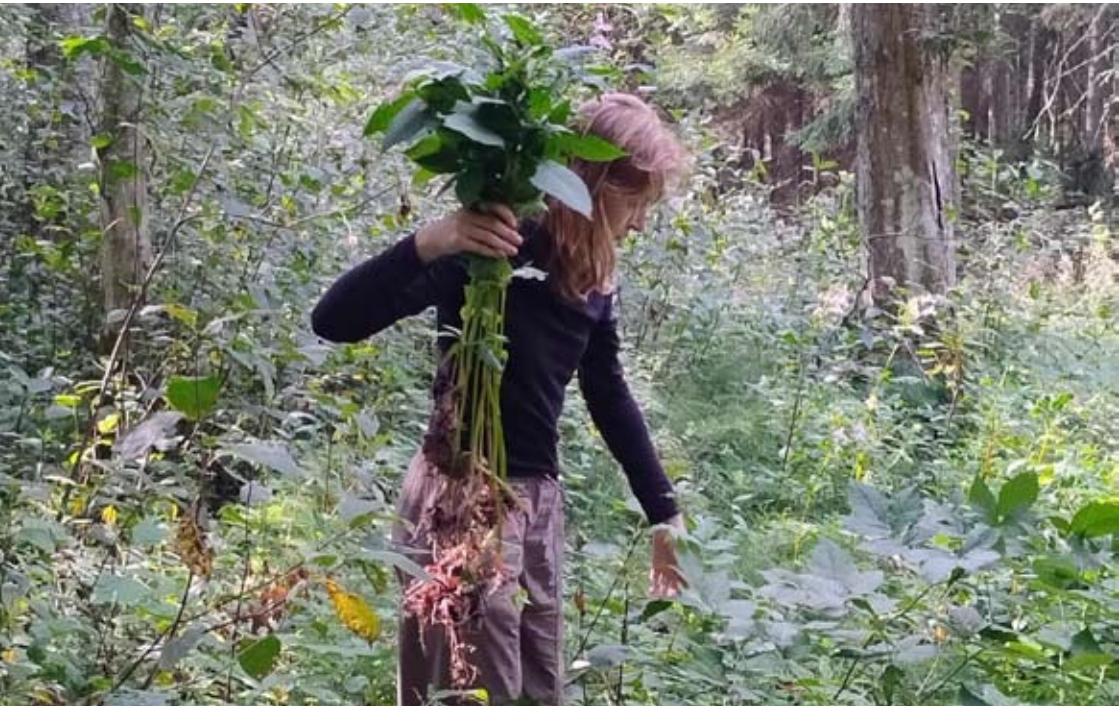
Baucamp in Estland 2024

Jetzt geht es darum, die gesäten Samen zu pflegen und mit der Zeit zu gehen. Ich bin gespannt auf die kommenden Herausforderungen, die bereits vor der Tür stehen, und freue mich, Ihnen und euch bald mehr berichten zu können!