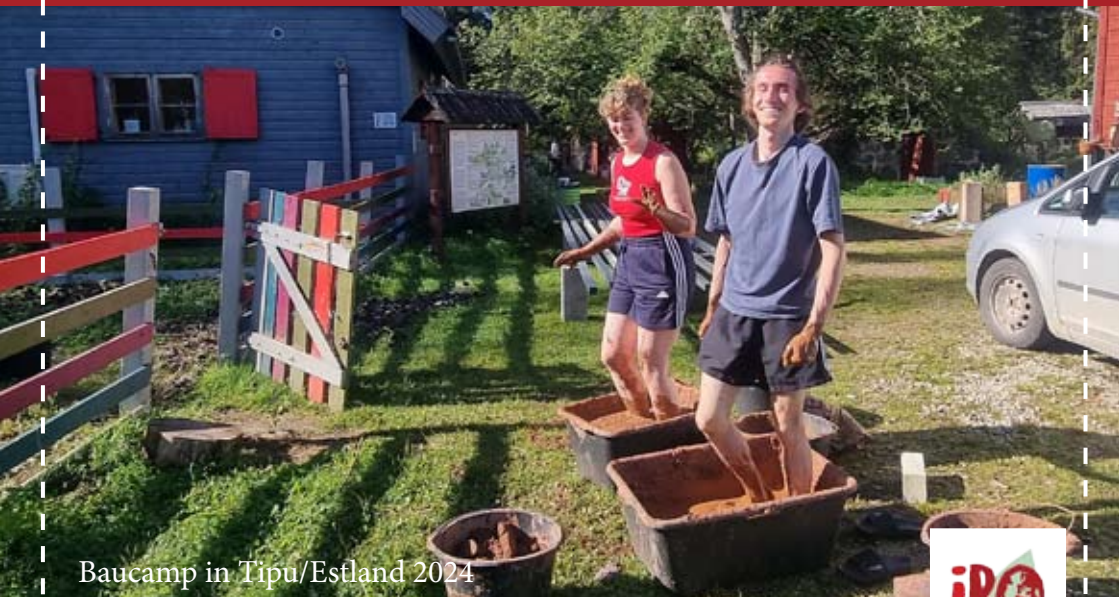
Baucamp in Tipu/Estland 2024